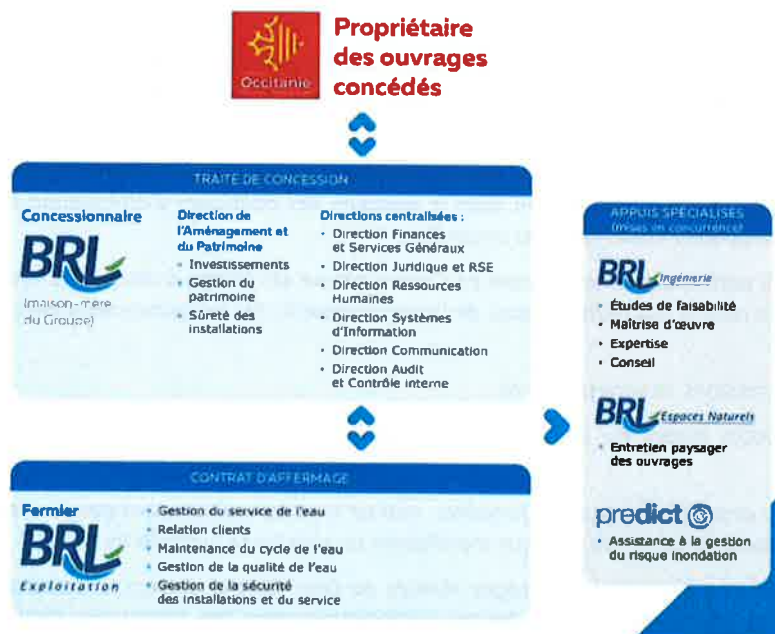
Schéma d'organisation du Réseau Hydraulique Régional

Accusé de réception en préfecture 034-213403363-20240930-202456-DE Date de télétransmission : 09/10/2024 Date de réception préfecture : 09/10/2024